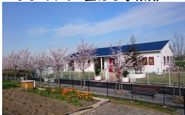
ぴよランド〈主たる事業所〉