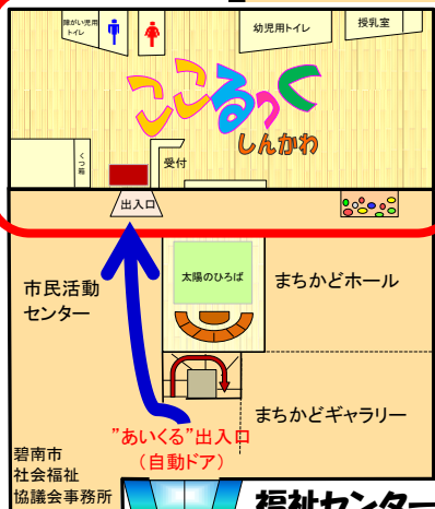
福祉センターあいくる 1F平面図

ファミリー・サポート・センターは、子育ての手助けをしてほしい人(依頼会員)と子育ての手助けをしたい人(協力会員)が会員となって、お互いに助け合い地域で育つ子ども達を応援する会員組織です。