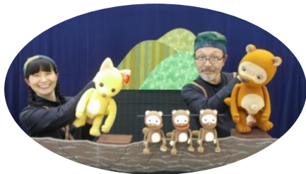
「こぎつねコンとこだぬきボン」

こころっくしんかわ、ファミリーサポートセンター、発達支援合同の交流会を27年度も開催しました。今回もファミサポ会員は先行販売を行い、むすび座の人形劇を楽しんでいただきました。