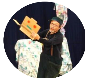
パフォーマンスと効果音のみ！笑いが いっぱいの「ヤンチャ・メッチャ・ブー」