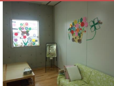
過ごし方は、あなた次第です