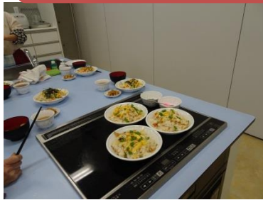
ちらしずしをみんなで作りました