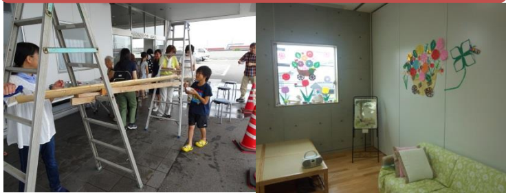
夏は流しそめんを楽しみました

へきなん福祉センターあいくる内 碧南市社会福祉協議会 地域福祉課 〒447-0869 碧南市山神町 8-35 電話 0566-46-3701 FAX 0566-48-6522 e-mail soudanshien@hekinan-shakyo.jp