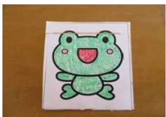
②「ぱっちゃんがえる」