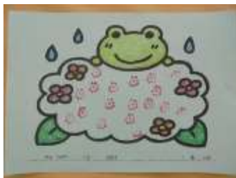
①「あじさいスタンプ」