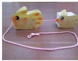
② おさんぽピヨピヨ